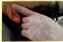
フェイスラインの乳化