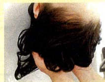
乳化後、お流しをした状態

乳化開始から5分位を目安に、地肌と髪の色水がゆるく、お湯を加えただけで流れる状態まで乳化し、その後しっかりと流します。