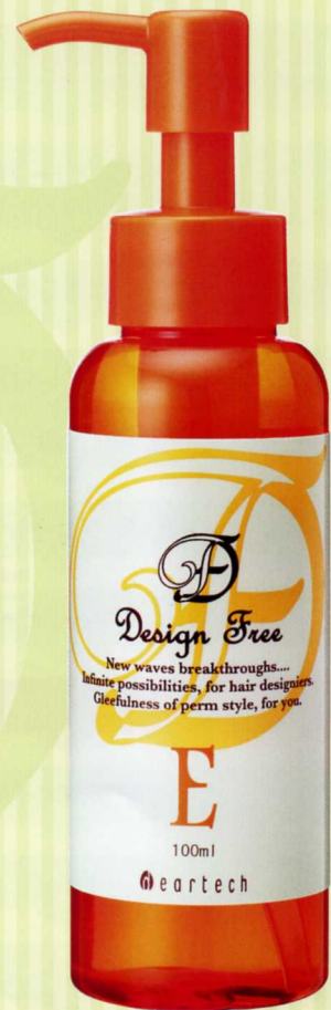
デザインフリー E 100ml [pH:3.6]

エルカラクトン(γ-ドコサラクトン)は、ドライヤー、アイロン、デジタルパーマなどの熱を加えることにより毛髪内部及びキューティクルの補修をおこなう、熱系ヘアケア成分です。熱を与えることにより毛髪内部成分(たんぱく質)のアミノ基と反応・結合します。毛髪と結合することで、使用直後だけではなく、シャンプー洗浄を繰り返しても残存性が高く、持続的なケア効果が得られます。また、毛髪の『うねり』、『ハリコシがない』、『ツヤがない』などの加齢により増加する毛髪のような悩みも改善できることから、エイジングケア成分としても期待できます。デザインフリーEはさらにCMC成分(セラミド2、コレステロール、18MEA類似体)を加えることで、より補修効果を高めハイダメージ毛への補修を可能にしました。