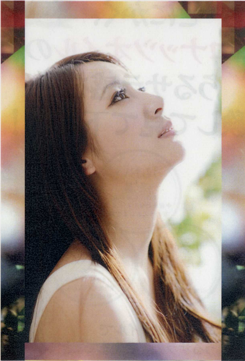
トリエ エマルジョン ココヴェール 心地よい髪ざわり・まとまり続くトリートメント