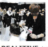
REALITIVE (リアリティブメイキング) デザイナーのクリエイティブなセンスが光る、 日常のシーンでパッと目を引くリアリティブデザイン