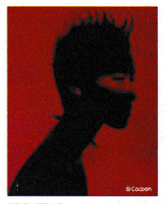
CREATIVE (クリエイティブフォト) デザイナーの 自分印を表現した クリエイティブデザイン